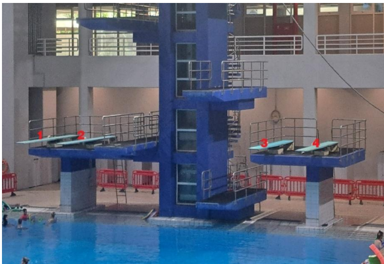
Πύργος καταδύσεων ΟΑΚΑ